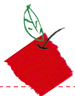
表紙もたのしく しちゃお！