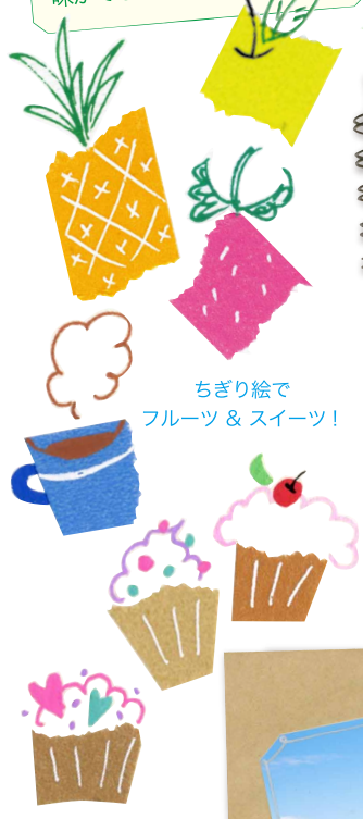
ちぎり絵で フルーツ & スイーツ！

プレゼントモチーフのちぎり絵は「ポスカとマスキングテープのかわいい組み合わせ100」を参考にしてみてくださいね！！