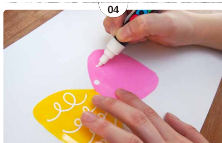
04 乾いたら、裏面に中字(PC5M)で模様と名前を書く。