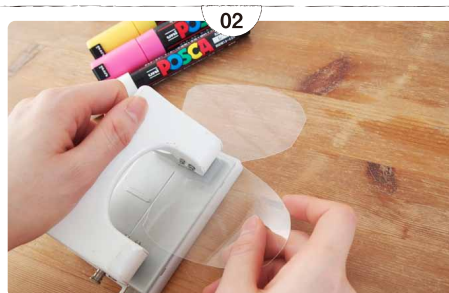
02 紐を通すための穴をパンチであける。