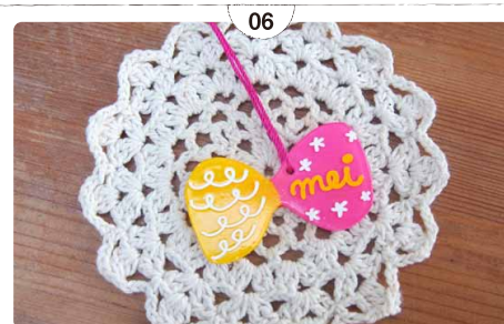
06 熱に強く平らなもので上から軽く押さえる。ひもを通して出来上がり!!