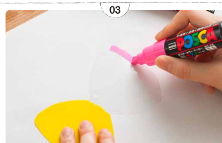
03 表面を太字(PC8K)で塗りつぶし、乾かす。