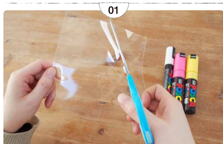
01 プラバンを好きな形にカットする。